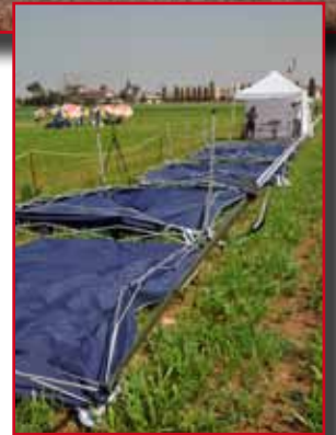
Il disastro sul Campo B, provocato dal distacco di una grossa termica. Disaster struck on field B when a powerful thermal destroyed the tents.