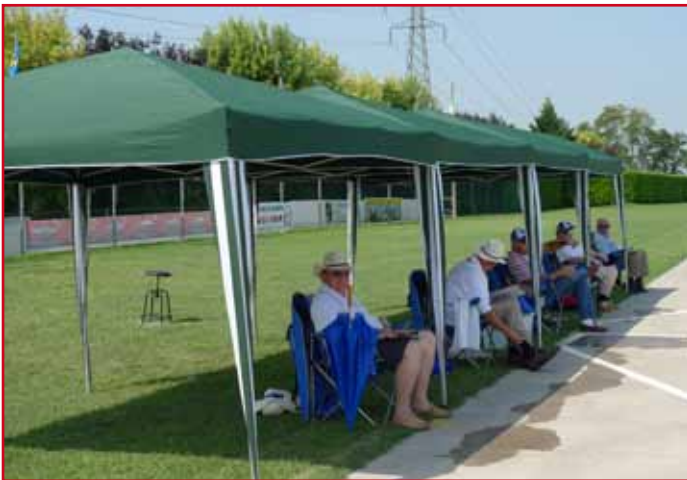
Judges at work.